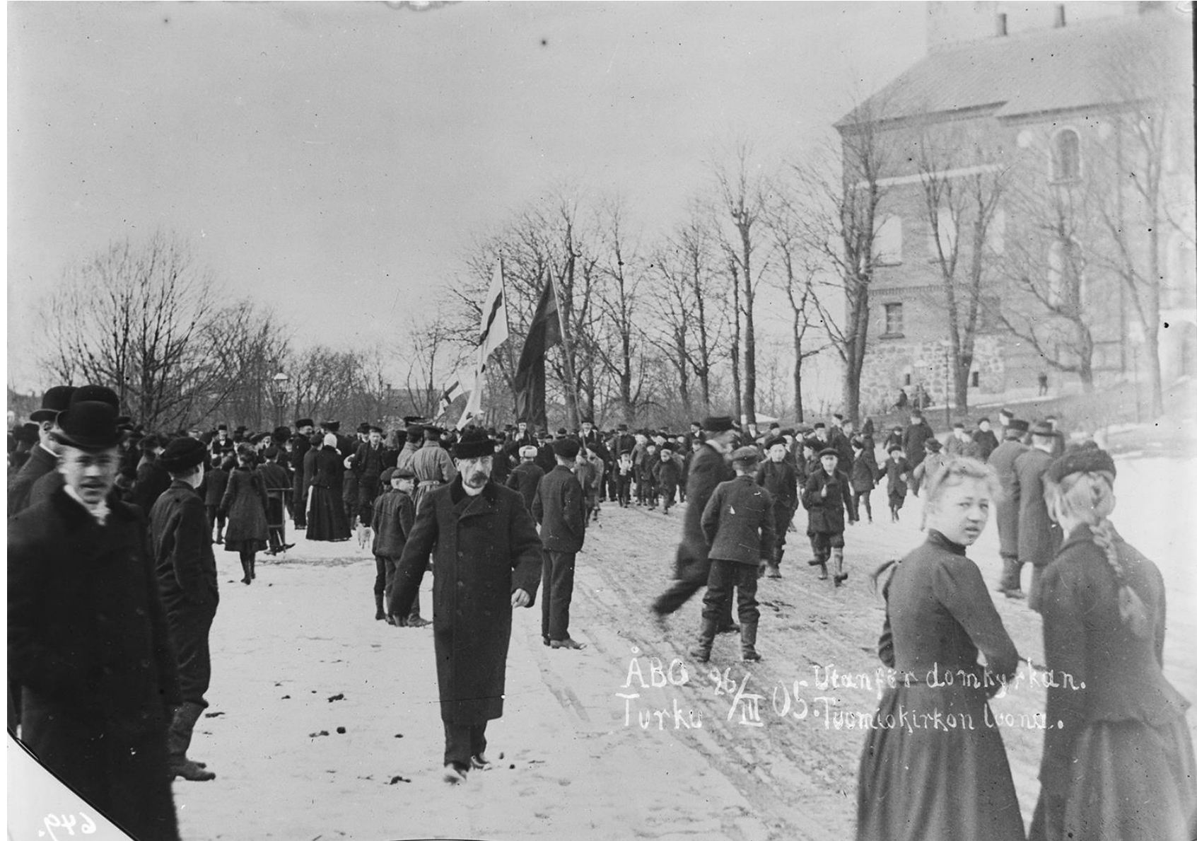
Perustuslaillisten kansalaiskokouskulkue 26.3.1905.

Museon kuva- aineistossa yhteiskunnallisten poikkeustilanteiden kuvia on melko vähän ja ne eroavat muusta, melko seesteisestä, Turku-kuvastosta. Poikkeustilannekuvissa on aiheina varsinkin vuosien 1905, 1917 ja 1956 tapahtumia.