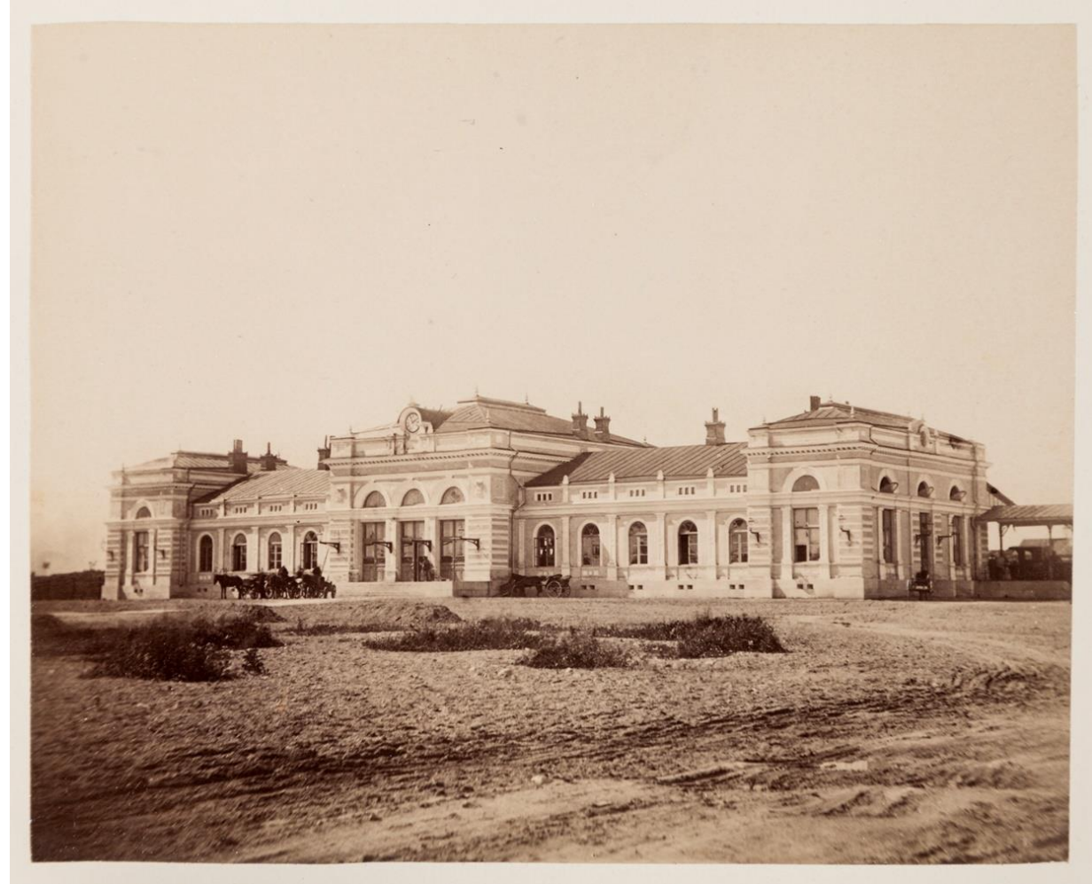
J. Reinberg: Turun uusi rautatieasema, 1878.