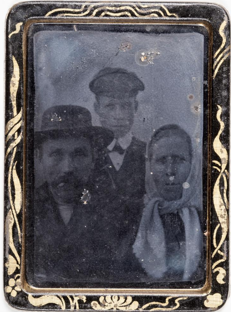
Tuntemattomia henkilöitä ikuistettuina Bosco-automaatin ferrotyyppiin, 1800-luvun loppu tai 1900-luvun alku.