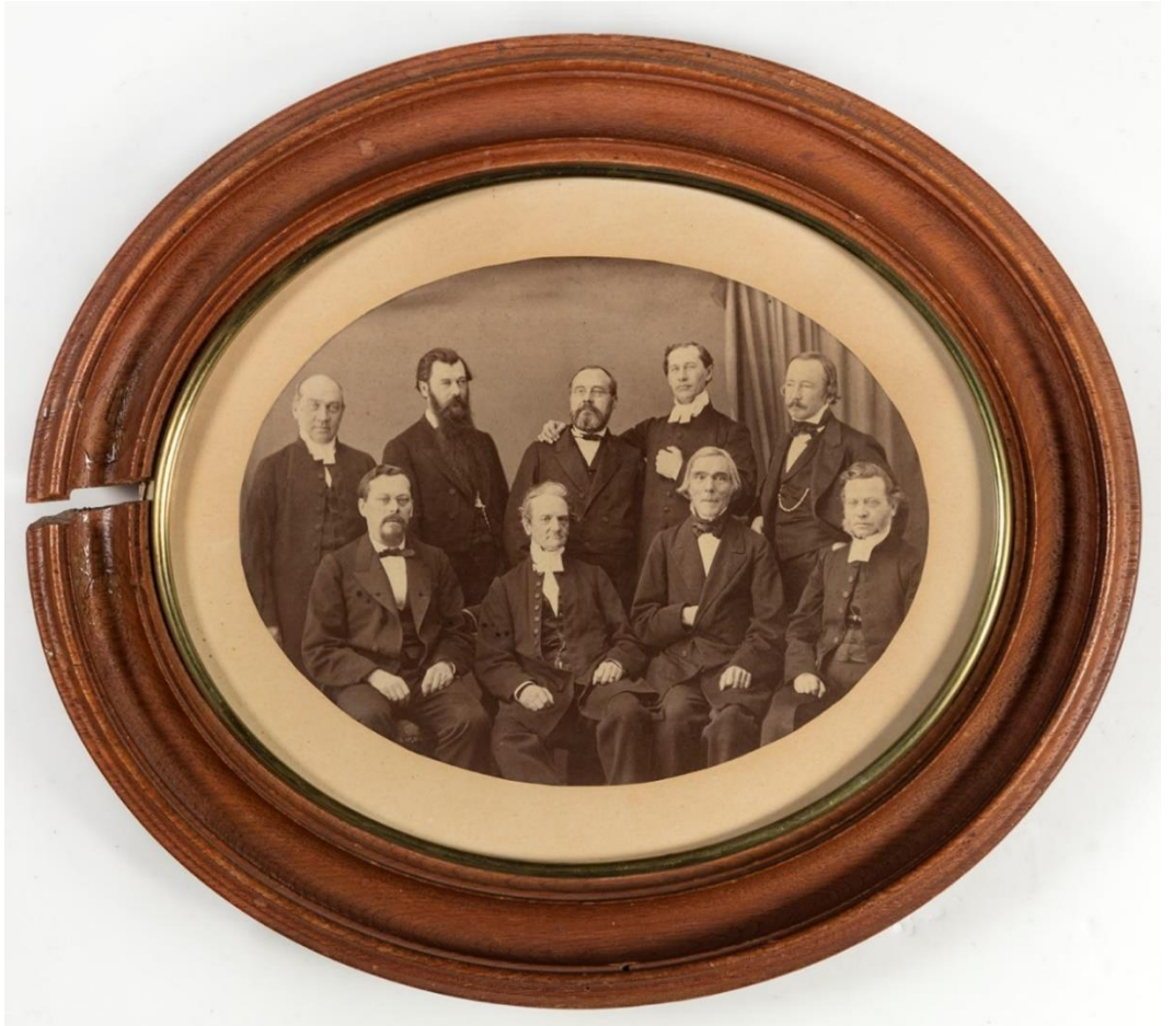
Ryhmäkuva virsikirjan uudistuskomiteasta (1863).