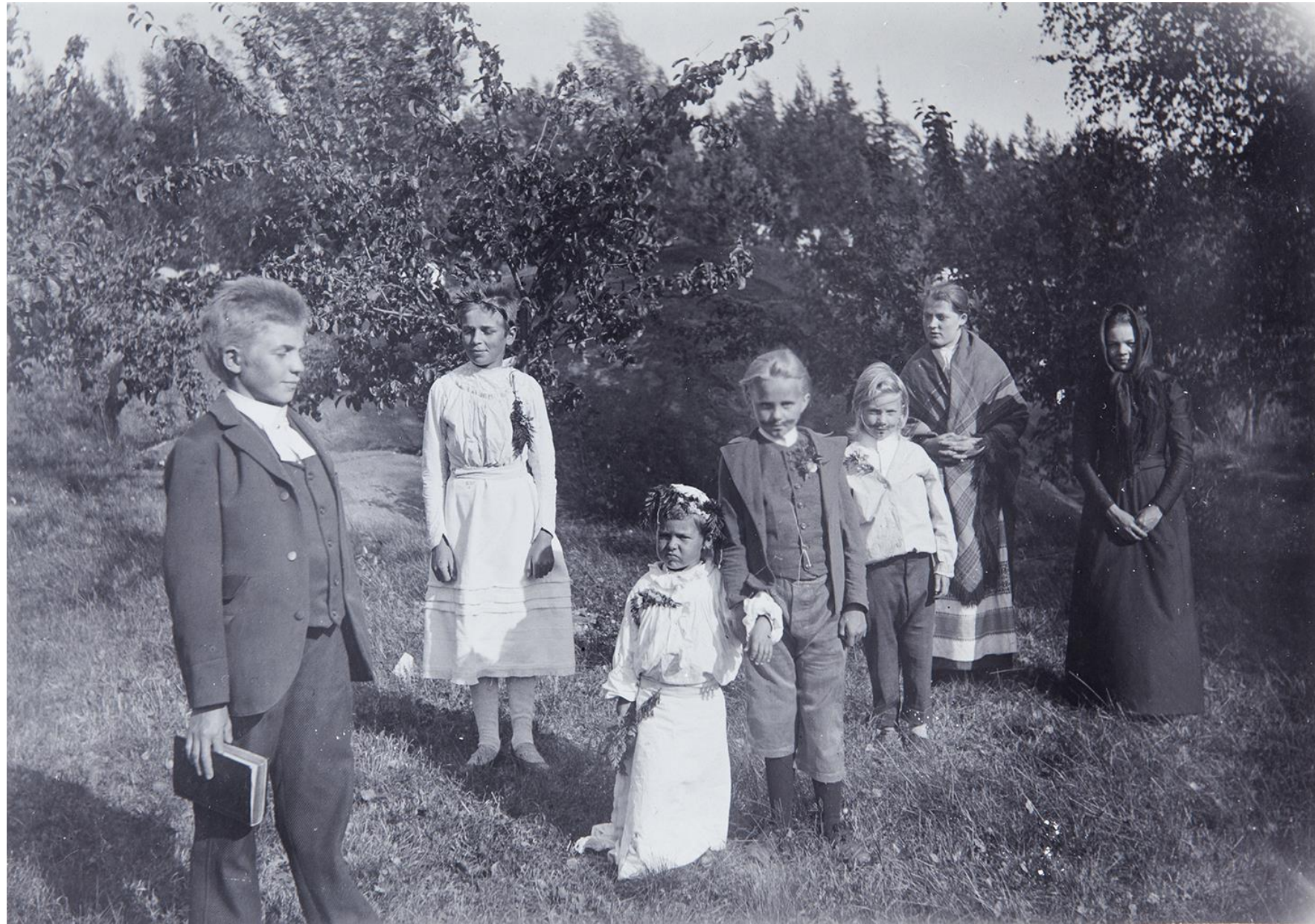
Lasten leikkihäät Kustavin Kallioniemessä, 1900-luvun alku.

Helsingin yliopiston ylioppilasosakunnilla oli aktiivinen ja tärkeä rooli kotiseuduntutkimuksessa ja kotiseututyössä. Sen seurauksena Varsinaissuomalainen osakunta lahjoitti vuonna 1914 museolle n. 4500 kuvaa Turusta ja Varsinais-Suomesta.