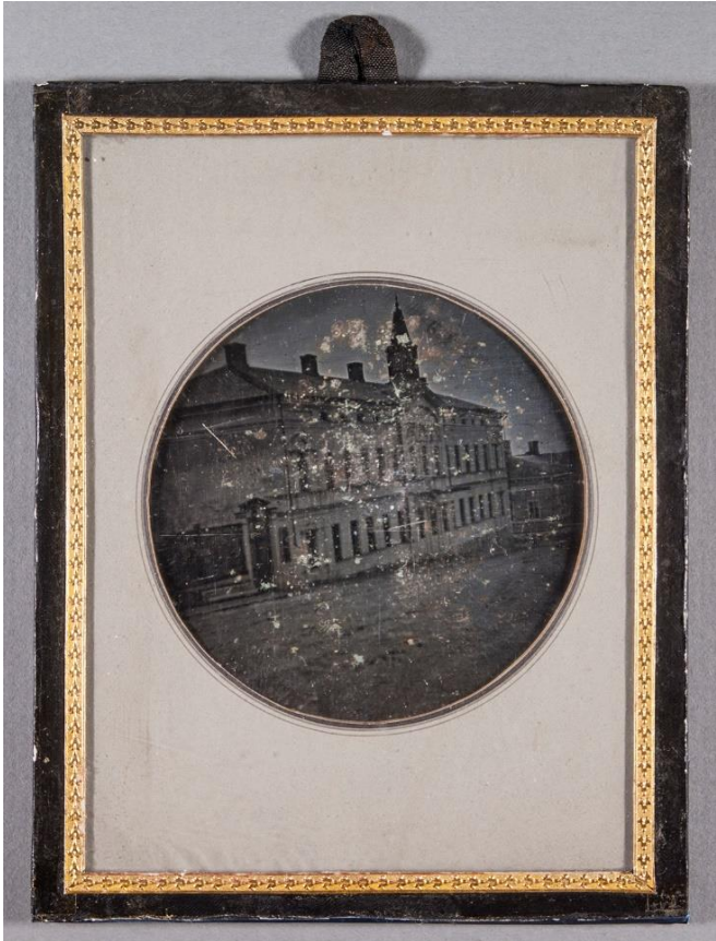
Suomen vanhin valokuva: Nobel-talo Turussa 3.11.1842