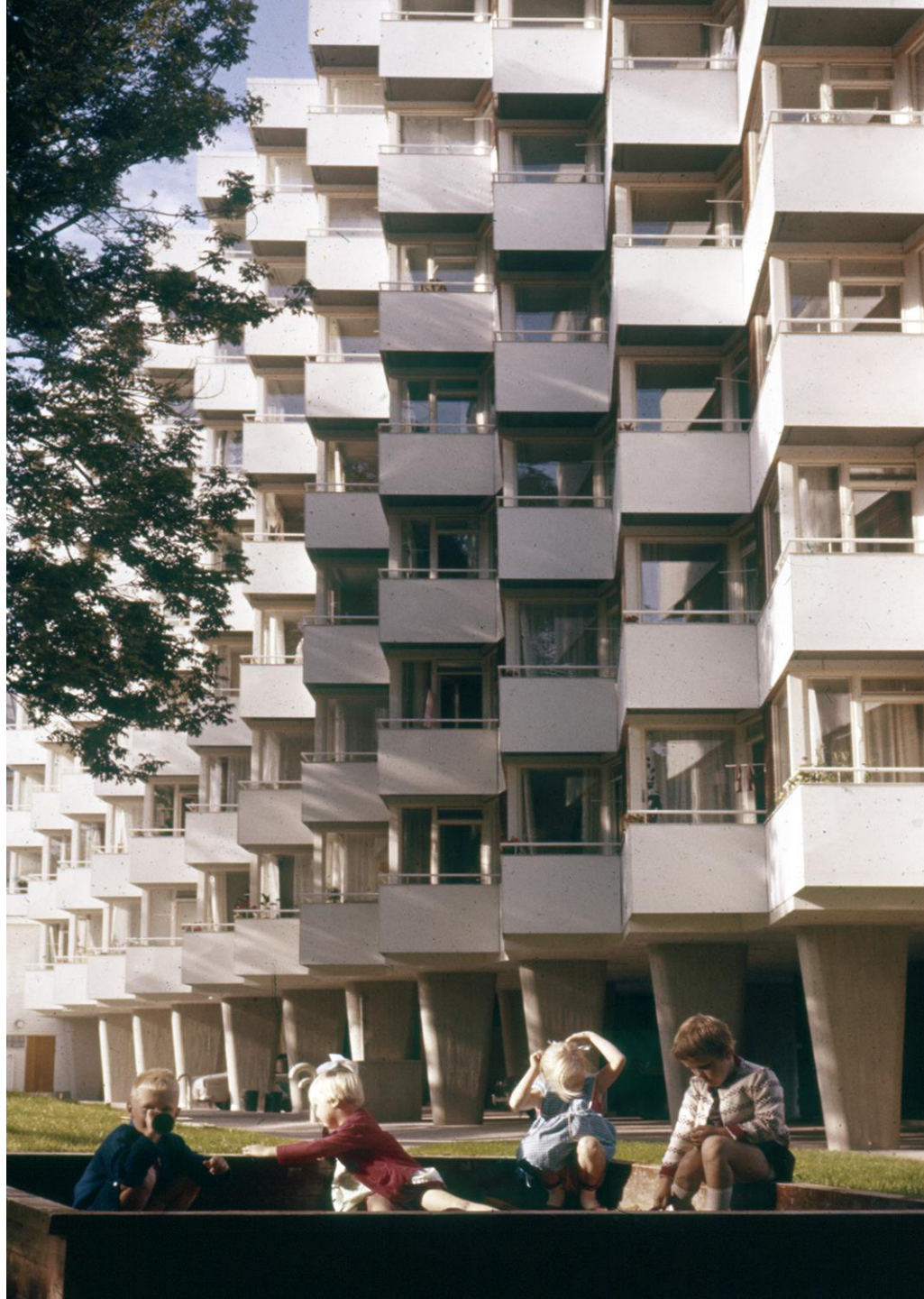
Keijo Hakanen: Kauppiaskatu 2, 1961.