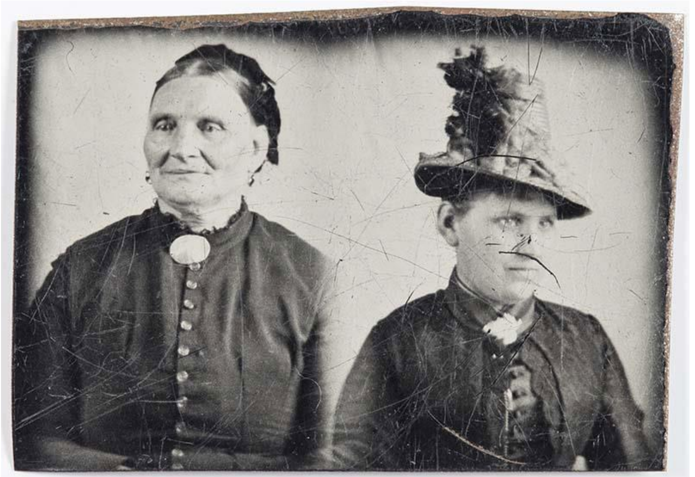
Kahdesta kuvasta yhdistetty kaksoismuotokuva. Ferrotyyppi.