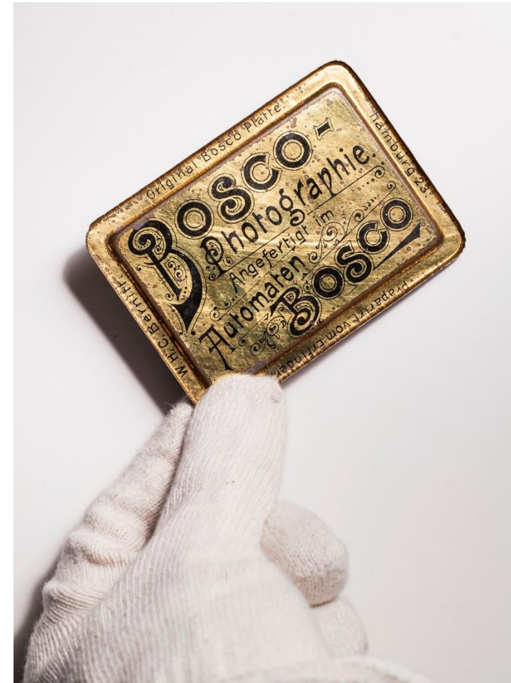
Ferrotyyppin taustapuoli. 2016.