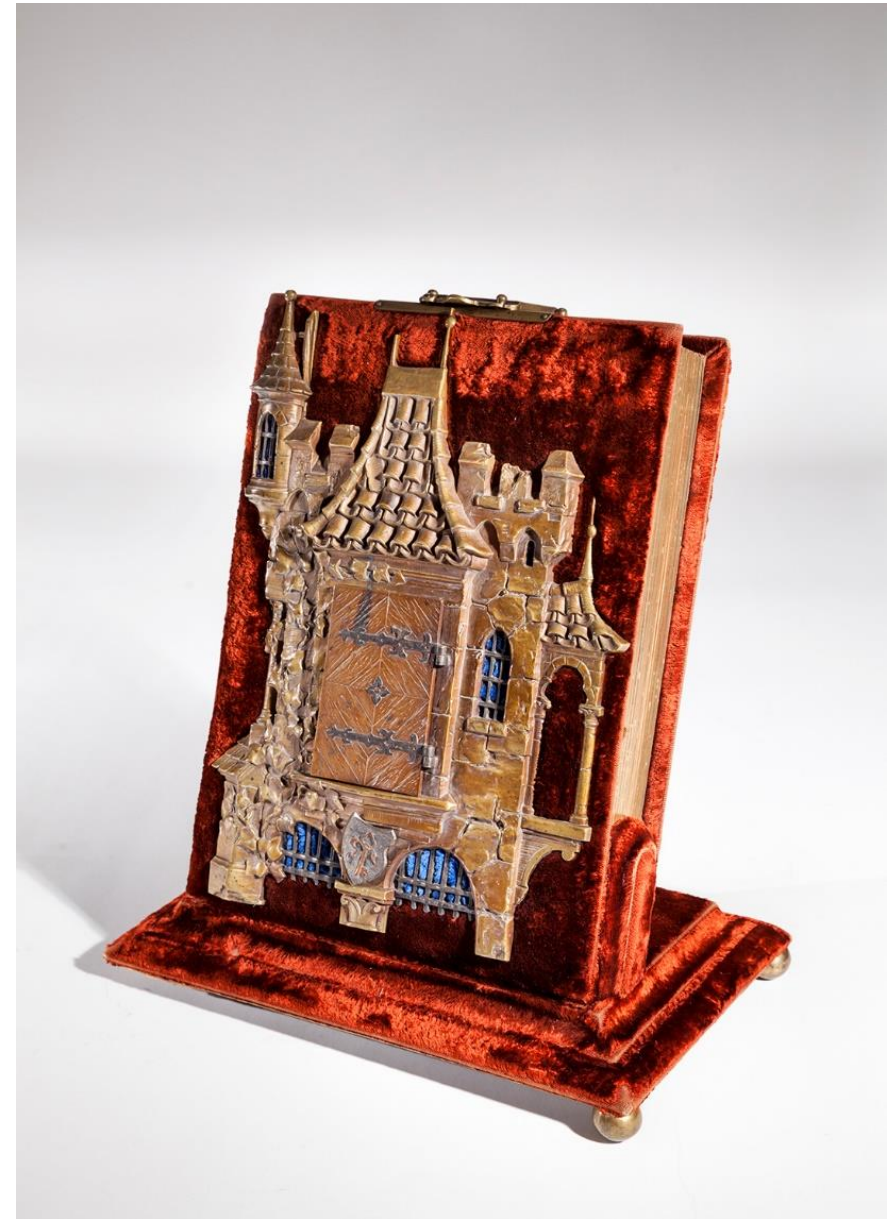
Eläinlääkinnän lehtori Ludvig Fabritiuksen sama muistoalbumi vuodelta 1886. Kuva: Aleks Talve, 2016.