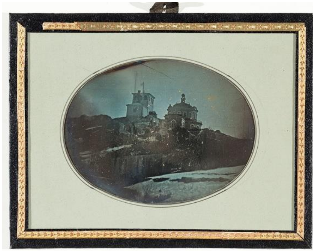
Tähtitorni ja palotorni Vartiovuorenmäellä, huhtikuu 1844.