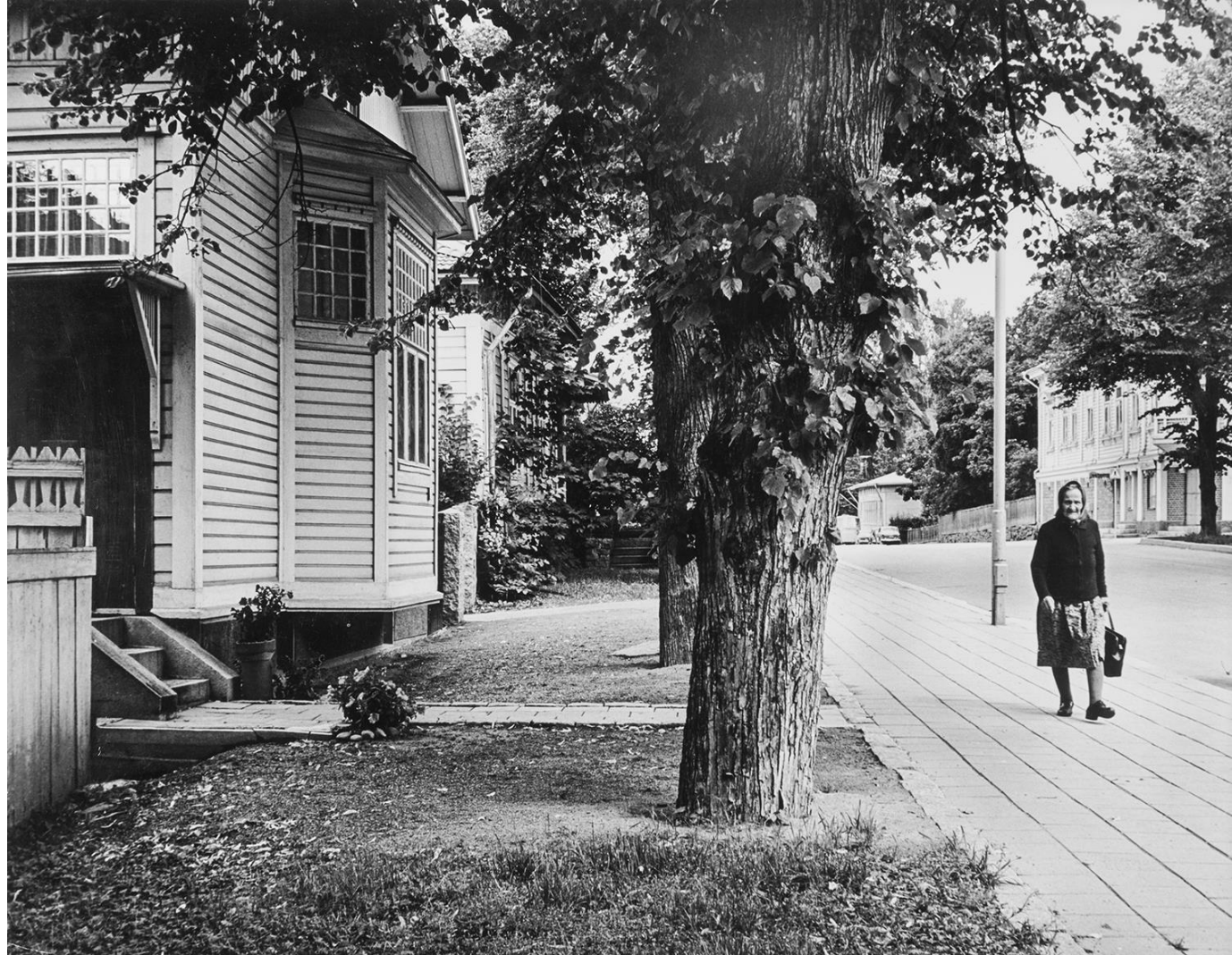
Kalervo Valli: Piispankatu, 1974.