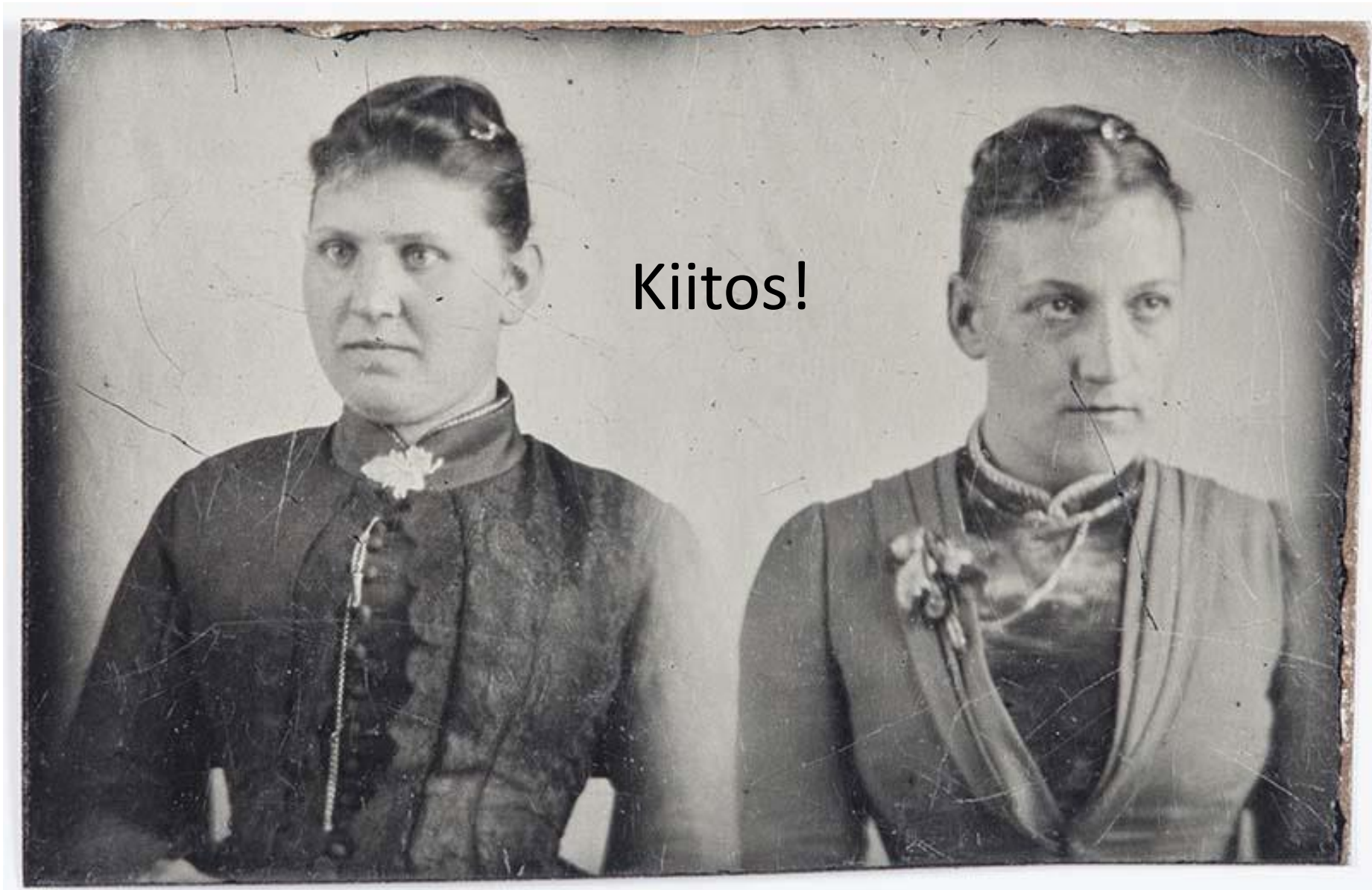
Kahdesta kuvasta yhdistetty kaksoismuotokuva. Ferrotyyppi.