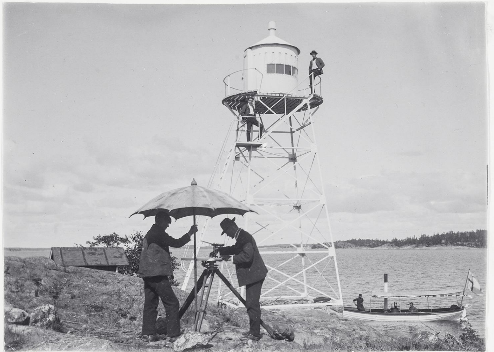
Maanmittausryhmä työssään Korppoossa, 1900-luvun alku.